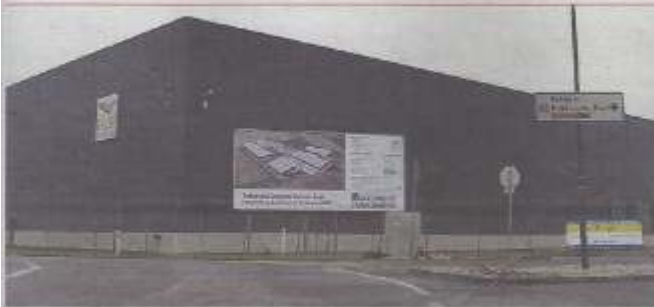
▲ Die Betriebsgebiet-Widmung für das Areal von DLH wurden schon in den 1980er-Jahren umgesetzt.

um die Betriebsgebiete im Magen, „weil diese Widmungen lange vor unserer Zeit passiert sind und wir ausbaden müssen, was andere beschlossen haben“, so Plöchl. Wunderer und Haderer sprangen für die Gemeinde daher in die Presche und erinnerten daran, dass sich die Gemeinde mit einem örtlichen Entwicklungskonzept, das gemeinsam mit der Bevölkerung in Arbeitsgruppen erarbeitet wurde, selbst reglemen-